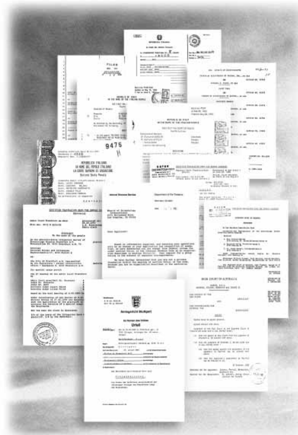
אלה הם רק חלק ממספר רב של החלטות בתי משפט והצהרות של המהות הדתית של הסיינטולוגיה. הכרות דתיות כאלה מוצאם ממדינות סביב העולם – מאלבניה לטיאון ומקוסטה ריקה לאיחוד המדינות ברוסיה.

בית משפט זה מוצא שכנסיית הסיינטולוגיה היא דת במובן תיקון החוק הראשון בחוקה האמריקנית. האמונות והרעיונות של סיינטולוגיה מטפלות בעקרונות יסודיים – טיבעו של האדם ויחסו האינדיבידואלי ליקום. התאוריה של סיינטולוגיה כרוכה בשיטת עיקרי אמונה מקיפה.